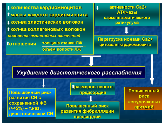
Рис. 1. Процессы, происходящие в миокарде у лиц пожилого и старческого возраста.

У больных с ХСН старших возрастных групп реже удается достичь целевых доз ИАПФ, чем у более молодых пациентов. Остается нерешенным вопрос, можно ли официально рекомендованные целевые дозы ИАПФ рассматривать как оптимальные для пациентов этой возрастной категории, поскольку указанные рекомендации базируются на данных многоцентровых исследований (SOLVD Treatment, VeFT II, ATLAS), включавших пациентов, возраст которых был существенно меньше (61–64 года).